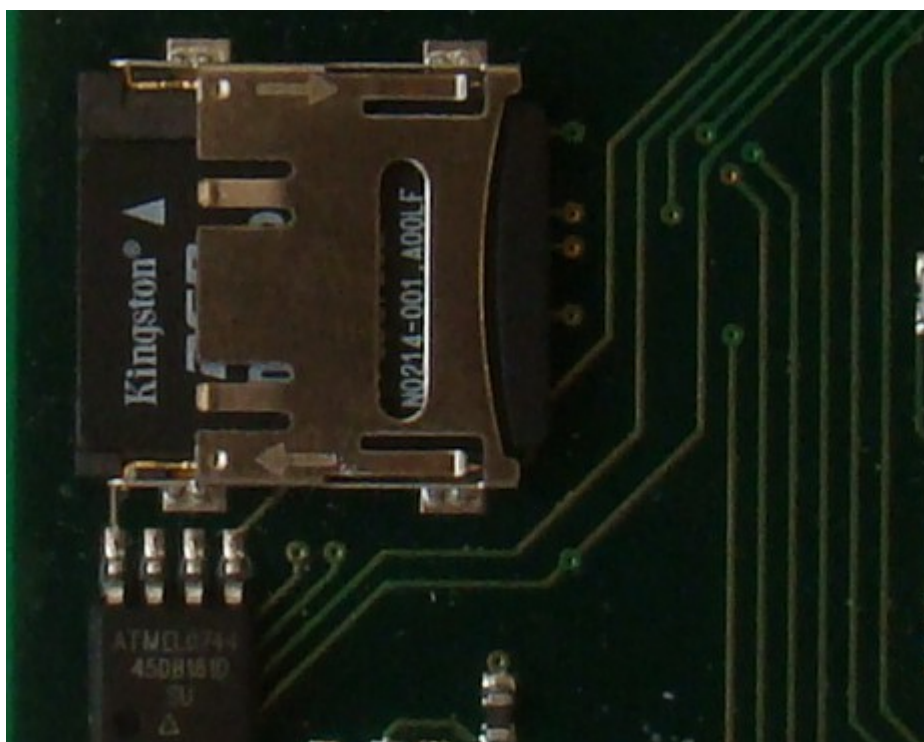
Рис. 3. Флэш – карта в держателе (холдере).

Для извлечения флэш карты сместите крышку по направлению нижней стрелки до щелчка(Рис. 3)