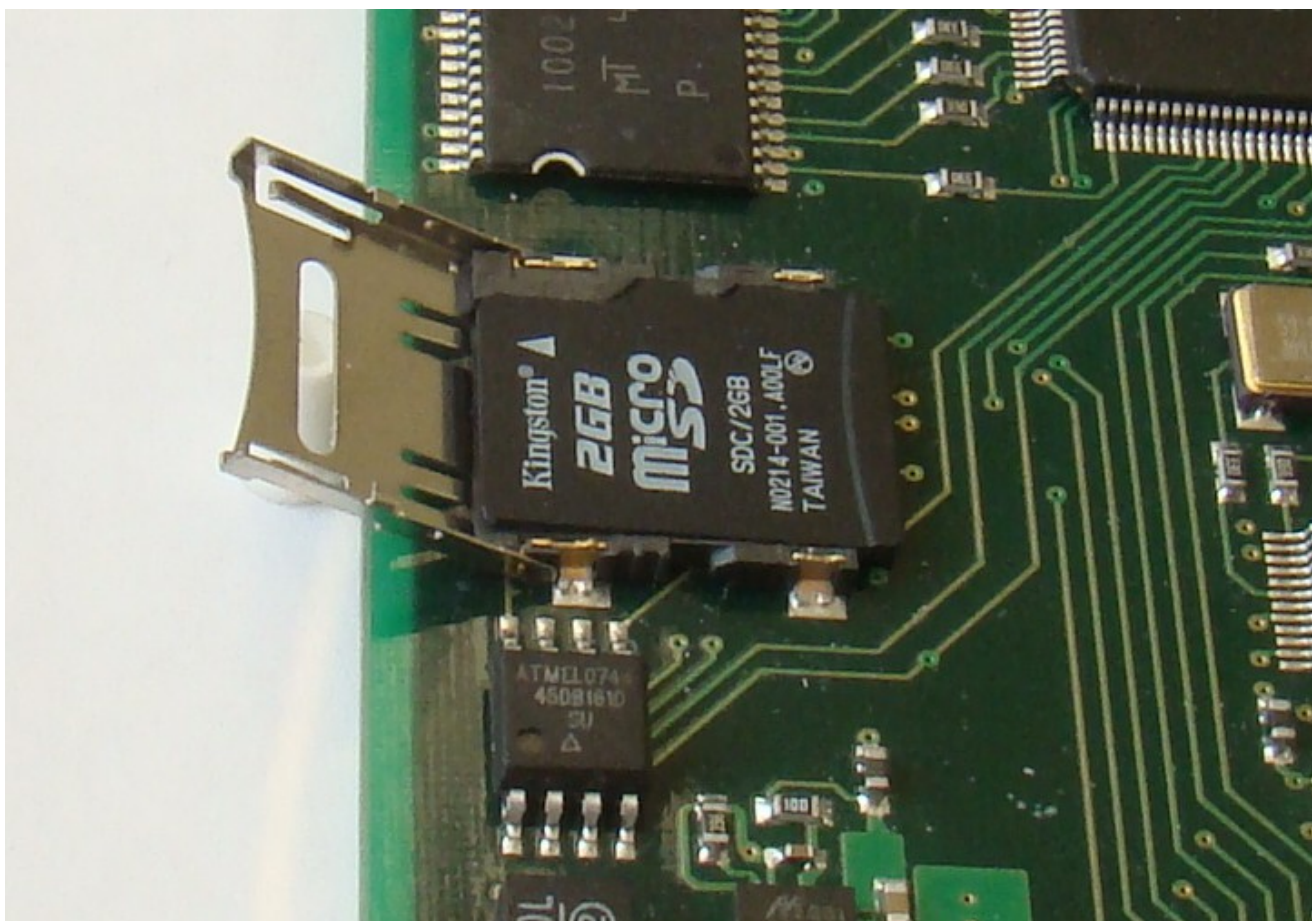
Рис. 4. Карта открыта.